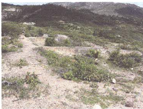
Huellas de las unidades de excavación de M. Temme en el Guagua Putushio.