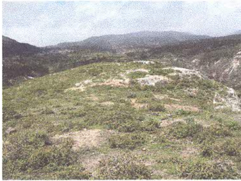
Cima del alto Putushío, al fondo la Prov. del Azuay

La cúspide es un espacio amplio y aterrazado, con algunos pozos de huaqueo, no obstante todavía se pueden observar espacios intocados y el espacio en sí, es interesante y prometedor para investigaciones arqueológicas científicas futuras.