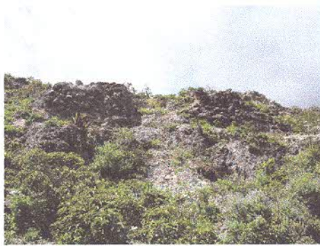
Muro interrumpido por corte de huaqueros

Putushío Alto es una loma inmediata a Guagua Putushío donde no se ha realizado excavaciones arqueológicas. En su ascenso inmediato a la cima podemos observar gran cantidad de piedras pertenecientes a muros derruídos -más por actividad antrópica que por efectos naturales-, asociados a fragmentos de cerámica, lítica, hueso (humanos y fáunicos) cuya densidad aumenta conforme nos acercamos a la cima de la loma; algunos segmentos pequeños de muros articulados resisten todavía a la depredación.