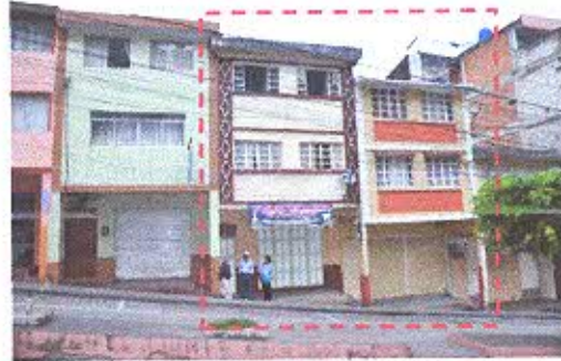
FOTOGRAFÍA NRO. 2. Edificación con ficha de inventario IBI-07-10-50-000-000010 - Piñas