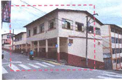
FOTOGRAFÍA NRO. 1. IBI-07-10-50-000-000025 de la ciudad de Piñas