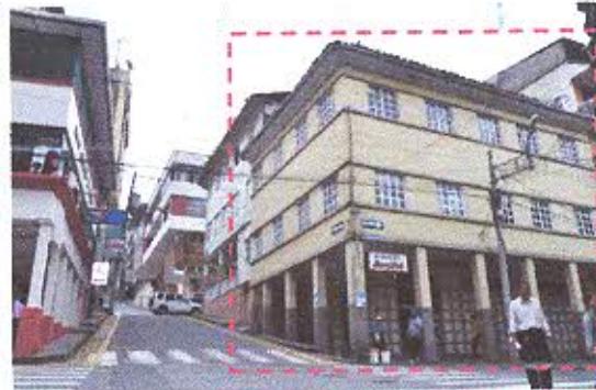
FOTOGRAFIA NRO. 4. Bien Inmueble - Piñas