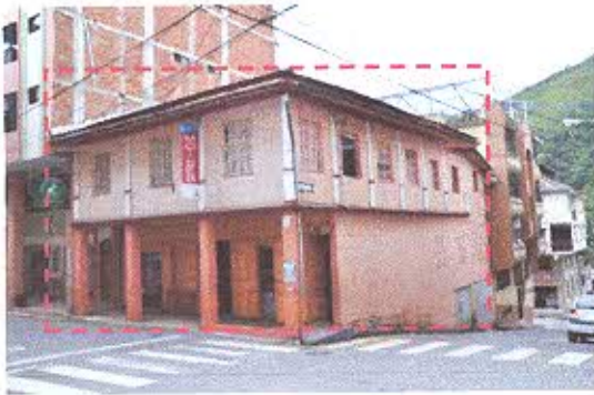
FOTOGRAFIA NRO. 3. Bien Inmueble - Piñas