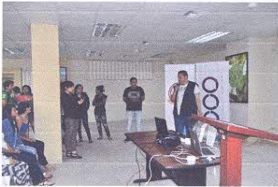
Figura 1.- Conferencia "Ámbitos y sub ámbitos del Patrimonio Cultural Inmaterial" en la Universidad Técnica de Machala.

inmaterial e inmaterial; como metodología de trabajo se les pidió a los participantes, en primer lugar identificar una manifestación cultural o un bien mueble o inmueble para que procedan a llenar la ficha de registro. De la misma forma se solicitó plantear las problemáticas a las que se enfrenta el bien cultural y pensar en una posible forma de salvaguardia.