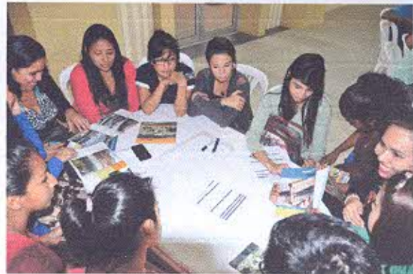
Figura 2.- Trabajo en grupos.