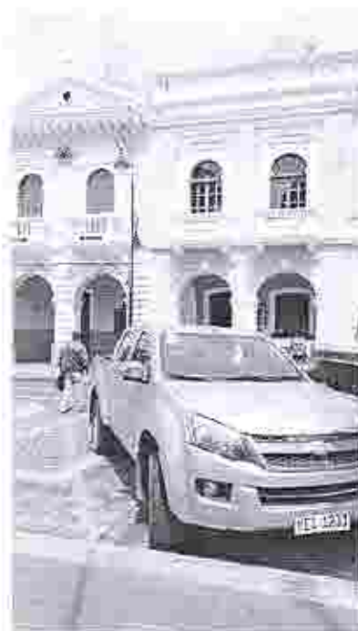
Visita a INPC-R3, Reunión con el Analista del área material Arq. Julio Cazar