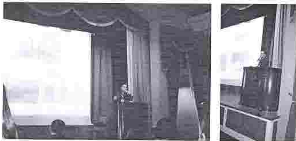
Ponencia en el 1er Encuentro Nacional de Etnobiología.

Las tipologías de viviendas, y su morfología llamaron la atención sobremanera de los geógrafos españoles y franceses del siglo XVIII, que señalaron no sólo las particularidades de las viviendas, sino también el entorno directo en el que ésta se desarrollaron: José Cardero (1790). Imagen de Guayaquil, en ella se ven perfectamente casas de Caña Guadúa.