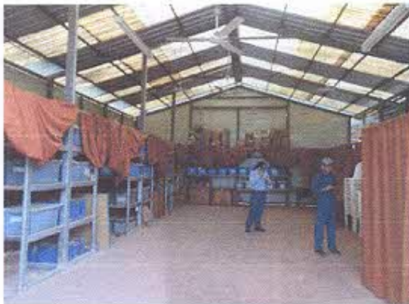
Foto 10.- Interior de la "Sala de Socialización y Capacitación-Proyecto Minero Mirador