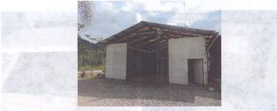
Foto 9.-Interior de la "Sala de Socialización y Capacitación-Proyecto Minero Mirador.