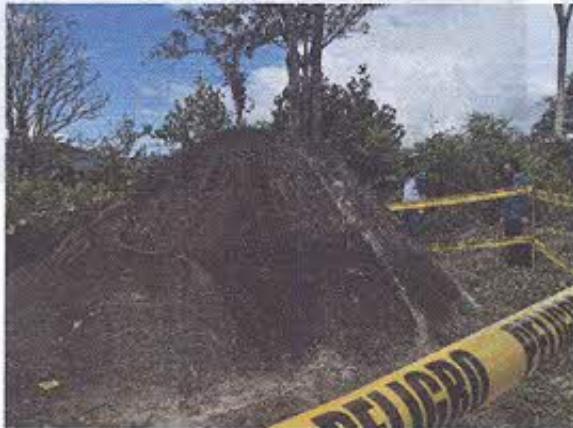
Foto 1.- Vista del Petrograbado de San Marcos, con cinta de peligro alrededor.

Al momento de la inspección del petrograbado se observó que se había retirado la maleza y colocado alrededor una cinta de peligro.