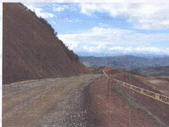
Foto 6.- Vía a canales construida sin monitoreo.

La “Vía a Canales” se encuentra en proceso de construcción, del total del trazado de la vía aproximadamente el 80% han sido ya aperturados y sus taludes estabilizados. Estos trabajos se han llevado a cabo sin el monitoreo arqueológico respectivo, según informa el arqueólogo de la empresa, lo que fue corroborado en los archivos del INPC-DR7, donde no fue posible ubicar la ejecución de investigación arqueológica para la construcción de esta vía.