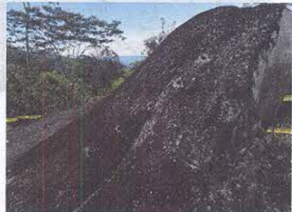
Foto 2.- Vista de las siete perforaciones realizadas en el petrograbado