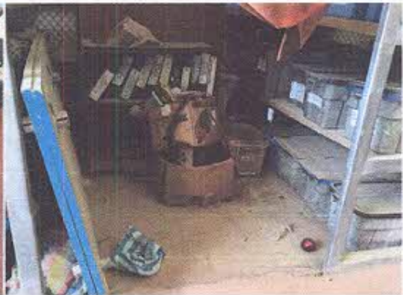
Foto 11.- Presencia de basura, polvo y elementos que no corresponden a una reserva y/o laboratorio y/o bodega de arqueología, demuestra abandono.