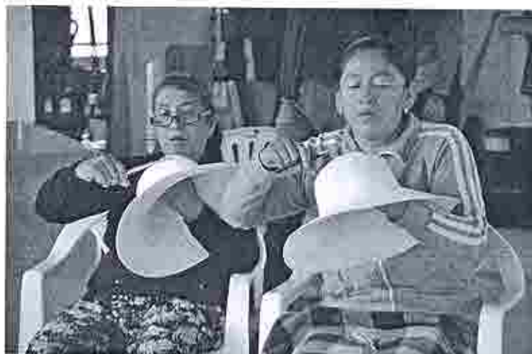
Tejedoras de sombrero de paja toquilla

Guayaquil Orellana No. 200 y Panamá, esquina Edificio Panamá 1er. Piso alto Ofic. 102 Telef. (5934) 23036717 2568 247