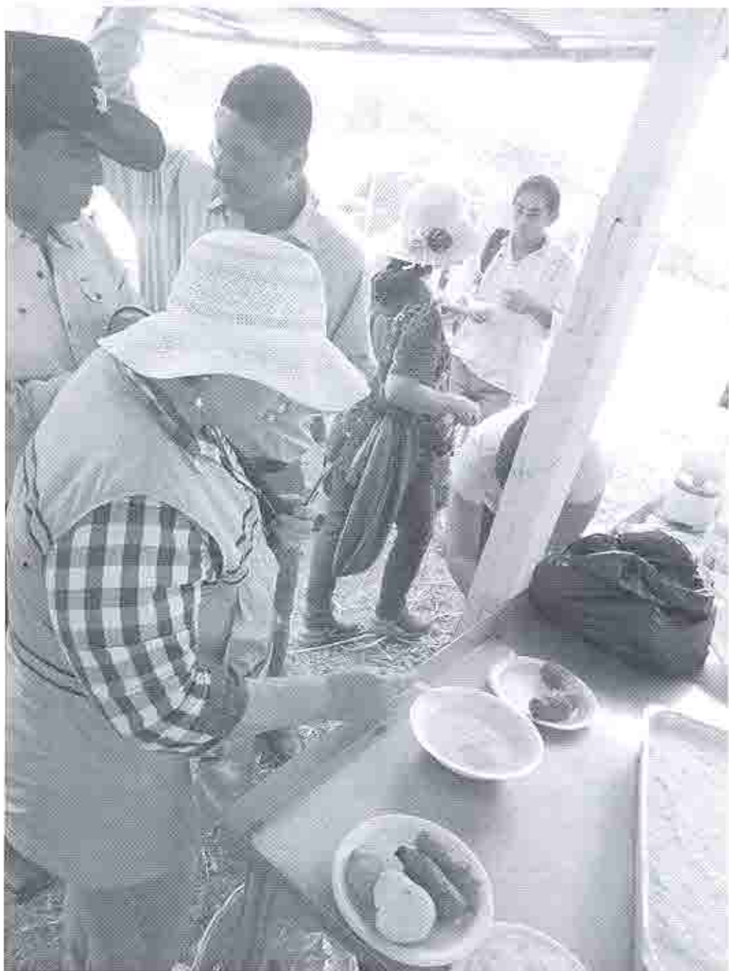
Degustación del Suero Blanco, con los bocadillos tradicionales de la cocina manabita con que se acompañan y realizan productos elaborados con el uso de la leche y sus derivados como el queso, con los que se realizan el pan de almidón y las tortillas de maíz.