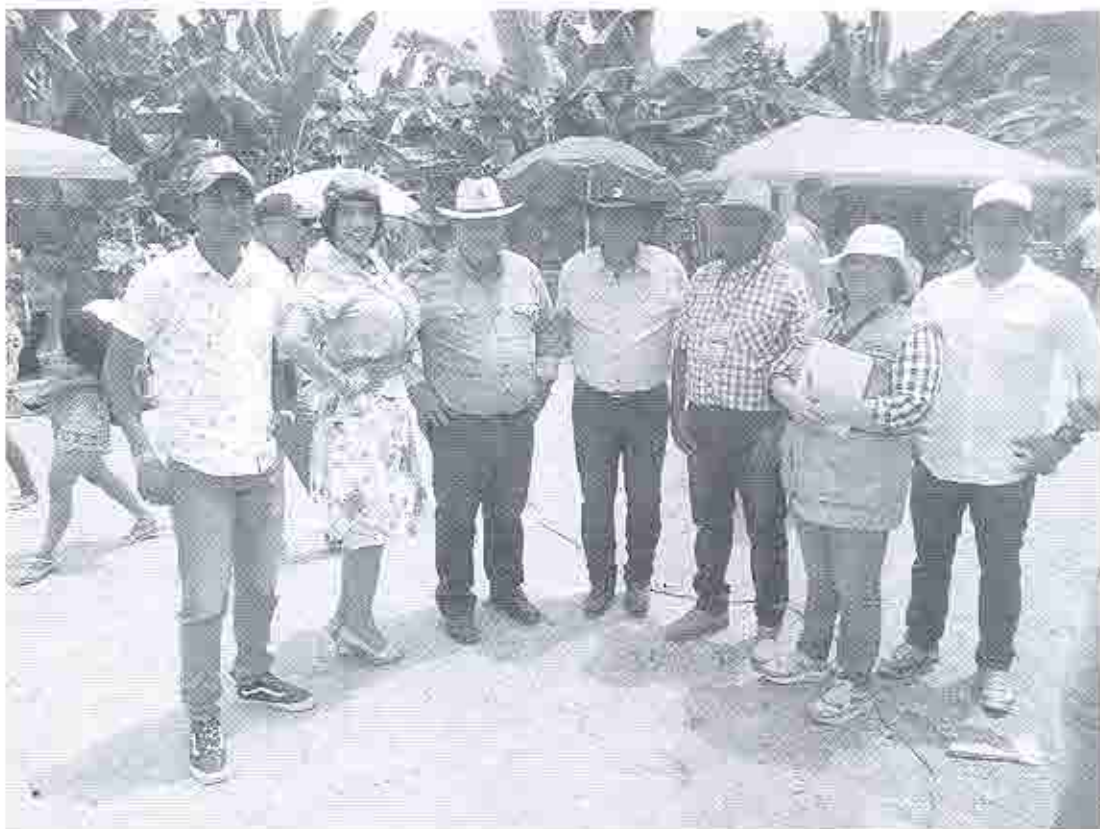
Grupo de ganaderos entre los que constan el Vice alcalde del GAD de Pedernales y el Presidente de la Junta Parroquial, con quienes se mantuvo entrevistas en el Festival del Queso, cuajada y suero blanco en Atahualpa el 10 de agosto de 2019.