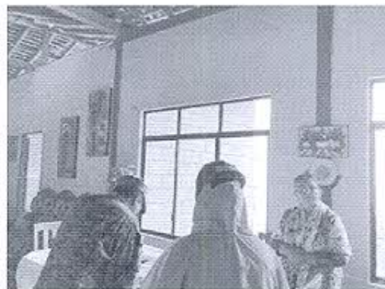
Fotografía 2: Personal técnico de equipo de trabajo realizando inspecciones de inmuebles patrimoniales en Zaruma.