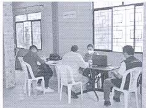
Fotografía 6: Reunión de trabajo con delegados de la Asociación de propietarios de inmuebles patrimoniales.