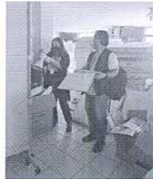
Fotografía 4: Levantamiento de bodega del Club Sucre.