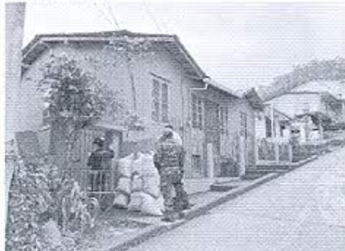
Fotografía 3: Personal técnico de equipo de trabajo realizando inspecciones de inmuebles patrimoniales en Zaruma.