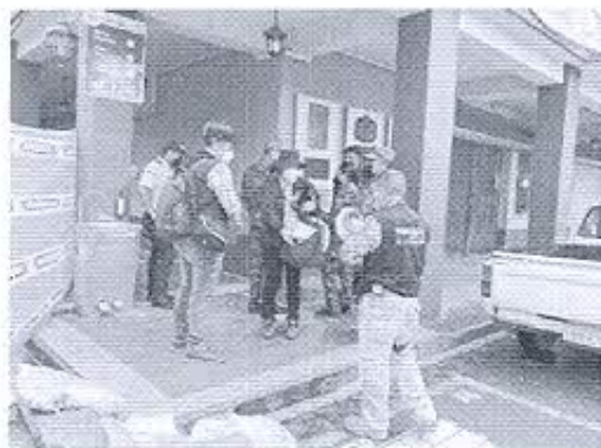
Fotografía 1: Concentración de equipos técnicos y acompañamiento policial y militar para realizar las inspecciones de inmuebles patrimoniales en Zaruma.