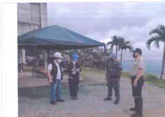
Fotografía nro. 1: Grupo 2 en inspecciones de inmuebles patrimoniales en Zaruma.