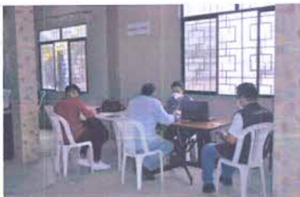
Fotografía nro. 4: Reunión representante de propietarios inmuebles patrimoniales