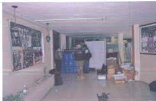
Fotografía nro. 3: Inspecciones internas Club Sucre