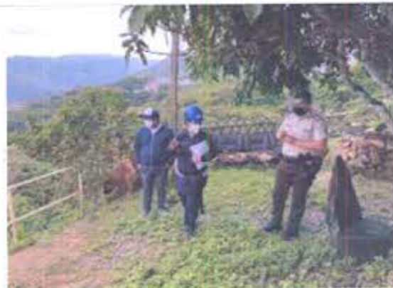
Fotografía nro. 2: Grupo 2 en inspecciones de inmuebles patrimoniales en Zaruma.