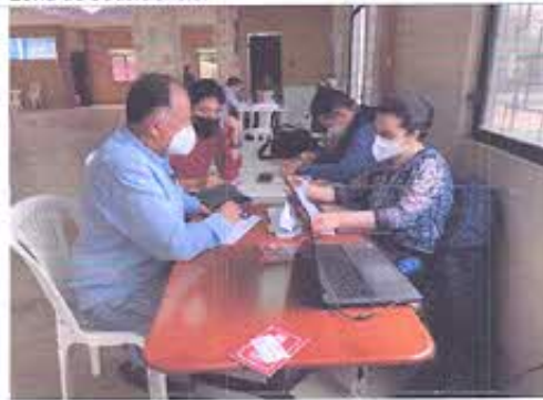
Fotografía N°3: Socialización de los trabajos ejecutados en la MTT7.