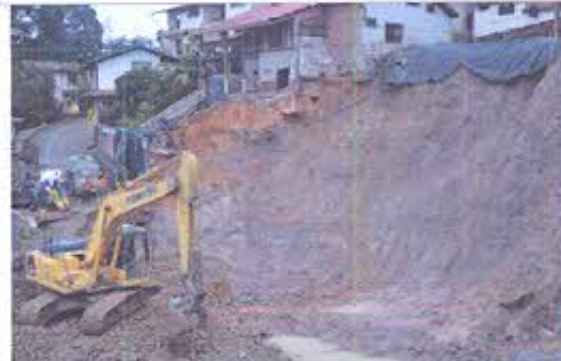
Fotografía N°2: Avance los trabajos de mitigación en punto donde se suscitó el socavón de fecha 15 de diciembre 2021