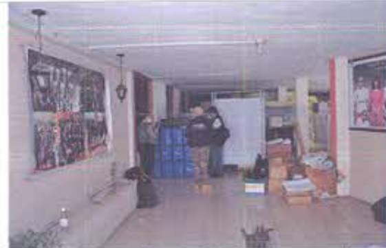
Fotografía N°4: Inspección al posible lugar de evacuación de los Bienes muebles culturales del Museo Municipal al posible contenedor Sucre.