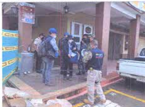
Fotografía N°1: Punto de encuentro previo a la evaluación de 18 Bienes Inmuebles Patrimoniales en la Zona de Subsistencia.